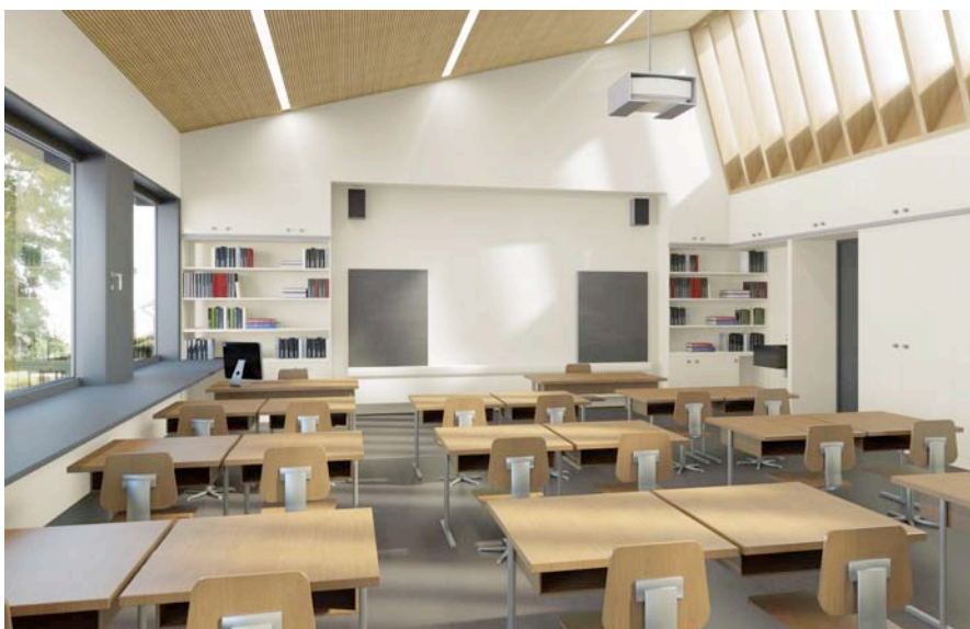
Ansicht Klassenzimmer Erweiterungsbau